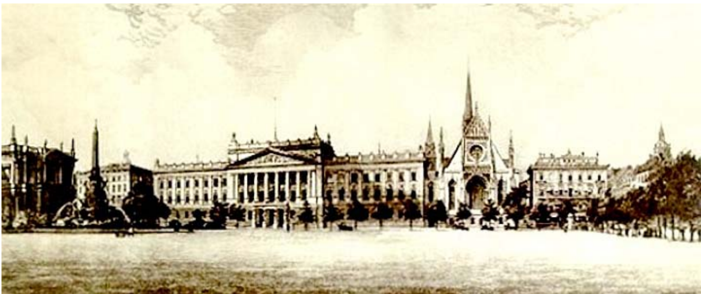
Augustusplatz von Osten (Radierung von Otto Sager 1909, Kunstbesitz der Universität)

Am 15. Juni 1897 wurde der neugestaltete Universitätskomplex eingeweiht. Die Kosten wurden mit 3 174 175 Mark abgerechnet 5 .