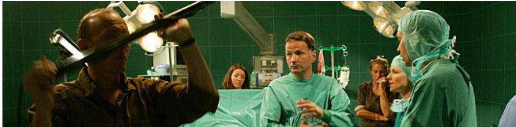
Chefarzt Dr. Roland Heilmann alias Thomas Rühmann beim Dreh

Das Studio für den Dreh „In aller Freundschaft“ befindet sich in der media city Leipzig. Wir konnten einen Blick in die Aufnahmeräume werfen. Beim Rundgang durch das Studio gaben viele Bilder von den Stars einen Eindruck über die bisherigen Drehs zu dieser sehr beliebten Arztserie.